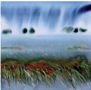
Elitsa Filcheva See 2011