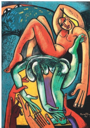
Mona Enayat Des Abends versammle ich die Sorgen um darauf zu schlafen 1996