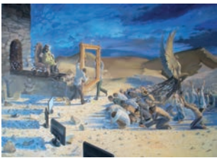
Zamir Yushaev Ruf des Sterns 2012