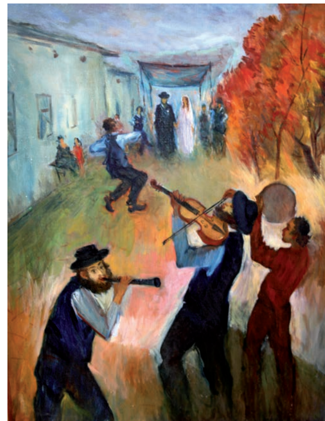
Maysey Faynberg Jüdische Hochzeit 2005, Öl auf Leinwand 100x80 cm

Mail: info@leipziger-hof.de www.leipziger-hof.de